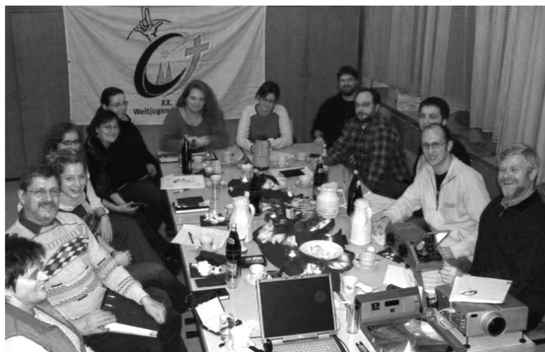
Vorbereitungstreffen „Deaf meets Deaf“ in Koblenz