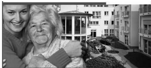
St. Martin | Alten- und Pflegeheim Heinrich-Heine-Str. 7-11, Ochtendung, Tel.: 02625 9587-0 www.ctt-trier.de